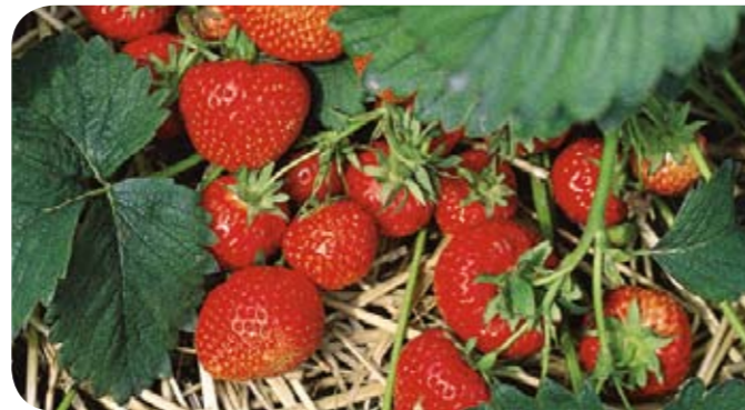
Stroh schützt die Erdbeeren vor Bodennässe und Erdverschmutzung.

Fragt man den Botaniker, so ist das mit den Erdbeeren keinesfalls so einfach wie man denkt. Der erklärt einem nämlich mit wissenschaftlichem Ernst, dass die Erdbeere überhaupt keine Frucht, sondern eine Scheinfrucht ist. Denn sie ist eine „Blütenachse“ bzw. ein „Blütenboden“, worauf sich die eigentlichen Früchte, auch „Nüsschen“ genannt, befinden. Das sind die kleinen Kerne auf der Erdbeere, die die von einer feinen Fruchthaut umhüllten Samen enthalten. Deshalb trägt die Erdbeere auch noch den seltsamen Namen „Sammelnussfrucht“. Wie dem auch sei – vergessen wir die Botanik und lassen wir uns die Erdbeeren, auf die wir uns jedes Frühjahr aufs Neue freuen, als wunderbar süße, aromatische und sehr gesunde Früchte (mit nur 32 kcal/134 kJ pro 100 g) schmecken!